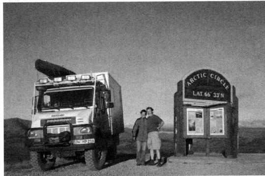
Am Arctic Circle.

Mitte April trafen wir, per Flugzeug, und unser Wohnmobil, per Schiff, in Halifax ein. Und am 19. April starteten wir dann unser Unternehmen Amerikaerkundung. Zunächst standen Nova Scotia, New Brunswick, Prince Edward Island und Cape Breton Island auf dem Plan. Neufundland liesen wir aus, da dort noch tiefster Winter war. Anschließend fuhren wir Richtung Westen über Quebec, Ontario Alberta nach Vancouver Island. Ende Mai begaben wir uns auf den legendären „West Coast Trail“, ein vor 100 Jahren eingerichteter Rettungsweg, der heute von Hikern so stark genutzt wird, das ein ein Permitsystem eingeführt wurde, das die Zahl der täglichen Abmärsche regelt. Für uns war es ein großes Abenteuer“!