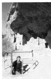
Ausstieg aus Kiva.

Ende August machten wir Station im Waterton NP (Kanada) an den sich der Glacier NP (USA) im Süden anschließt. Bide Parks arbeiten eng zusammen und werden als Internationaler Park geführt. Unsere Reise führte uns weiter zum Yellowstone NP, wo wir das erste Mal unser Faltboot ausgiebiger nutzen konnten. Wir paddelten 3 Tage über den Shoshone Lake und genossen die Einsamkeit. In den Sawtooth Mountains wanderten wir mal wieder ausgiebiger. (6 Tage mit Zelt und